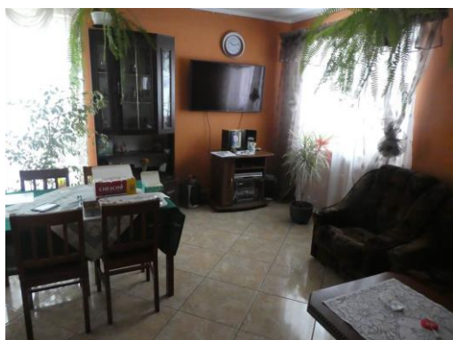
budynek mieszkalny - wewnątrz