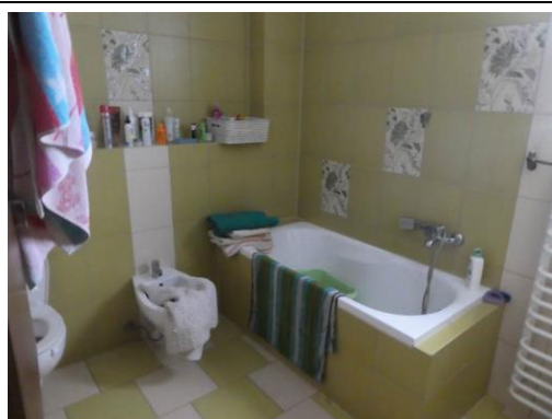
budynek mieszkalny - wewnątrz