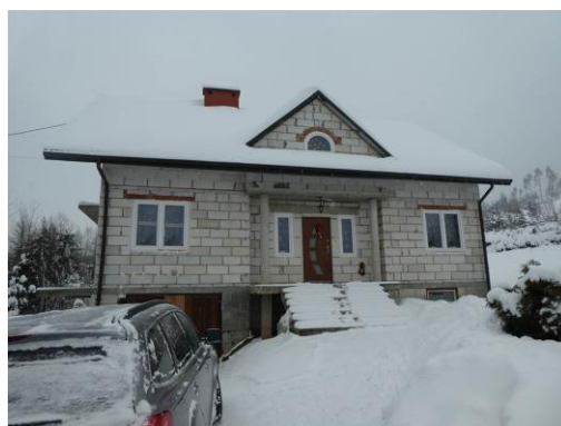
dz. ewid. 18/1 – – budynek mieszkalny