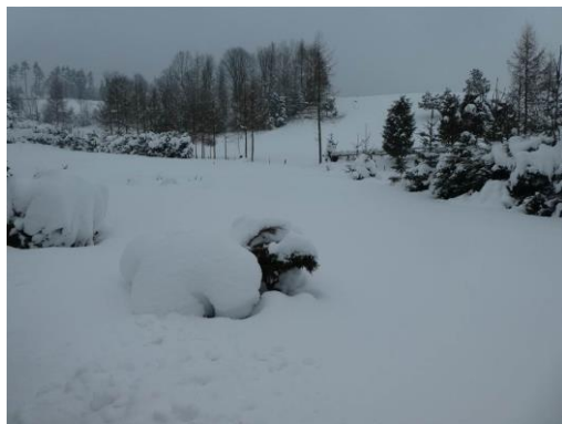
dz. ewid. 18/1 – widok ogólny