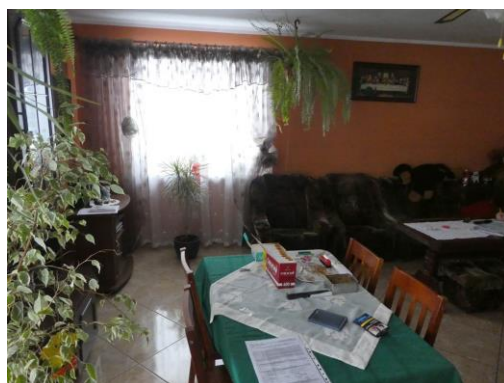
budynek mieszkalny - wewnątrz