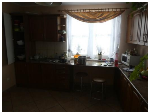
budynek mieszkalny - wewnątrz