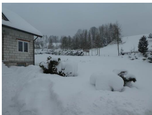
dz. ewid. 18/1 – widok ogólny