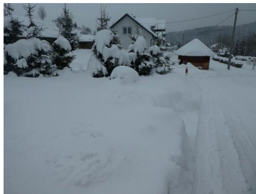
dz. ewid. 18/1 – widok ogólny