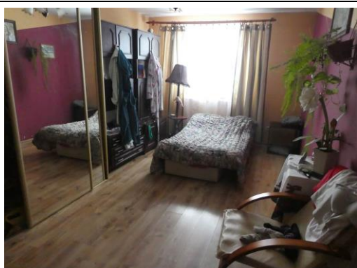
budynek mieszkalny - wewnątrz