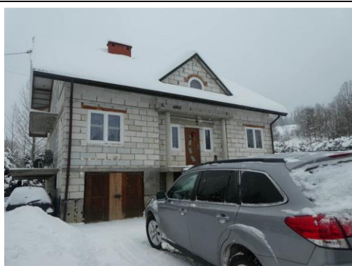
dz. ewid. 18/1 – – budynek mieszkalny